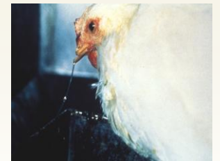
USDA 자료 사진 콧물(콧물 흐름)은 HPAI의 증세일 수 있습니다.