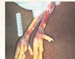
피부와 다리 출혈은 HPAI 바이러스에 감염된 조류가 나타낼 수 있는 증상 가운데 한 가지입니다.