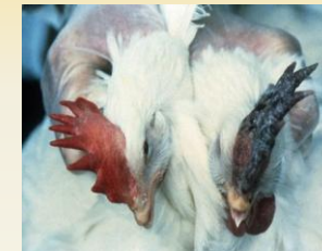
무릎의 자주빛 변색은 HPAI 증세일 수 있습니다.