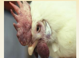
HPAI에 감염된 조류는 머리, 무릎, 턱뼈, 그리고 안면이 부어오를 수 있습니다.